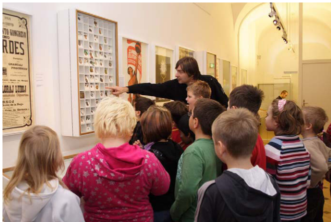
Ekskurso de infana grupo

Alia kialo de la pozitiva bilanco certe estas la fakto, ke la koncepto de la muzeo sin direktas al personoj, kiuj ĝenerale interesiĝas pri lingvoj kaj metas Esperanton en la pli vastan kuntekston de la lingva problemo unuflanke, kaj de historia evoluo aliflanke. Esperanto prezentiĝas al la publiko do ne kiel kuriozaĵo, sed kiel parto de la monda kulturo. Relative laŭ sia grandeco, la Esperantomuzeo estas la plej ofte vizitata muzeo en Vieno.