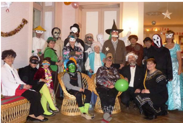
dum Novjara festo en Greziljono