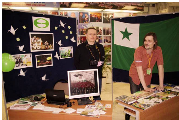
Esperanto-stando en la Festivalo