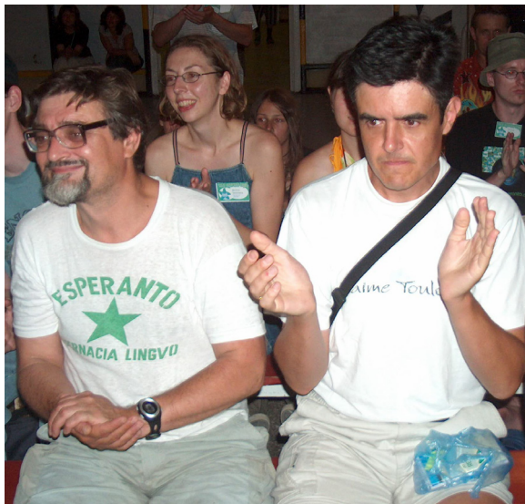
la vesperaj koncertoj ĉiutage altiris ĉies atenton

Aktiveco de la parto-prenintoj malnete ŝajnis al mi dubinda, ĉar tro multaj nekonataj nomoj ĉeestis en la listo de aliĝintoj. Feliĉe, nete ĉio okazis tute alie. La homoj aktivegis. La ple-