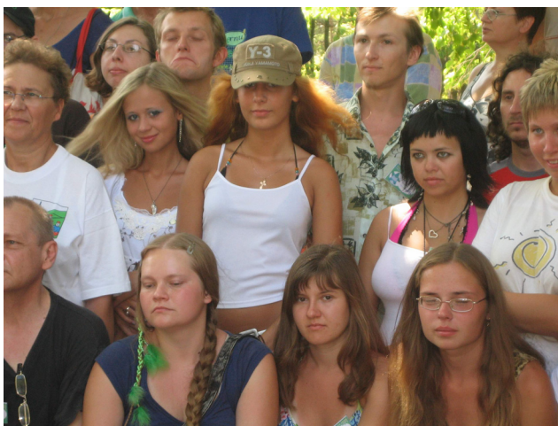
ina parto de la partoprenantoj plimultis en RET-07