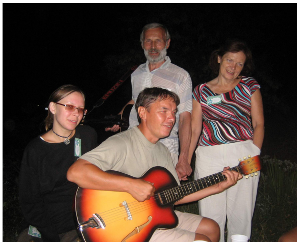
ne mankis, certe, ankaŭ la nokta kantado ĉe lignofajro