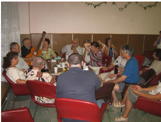
unu el la noktaj kunsidoj en gufujo

Plej multaj partoprenintoj naskiĝis en majo kaj julio (po 20 personoj), plej malmultaj – en aprilo (10 personoj). Plej ofta naskiĝdato estas la 11-a tago de monato (10 personoj), plej malofta – la 16-a (2 personoj).