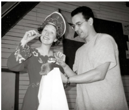
IJK-51 apud Sankt-Peterburgo pasis tre sukcese

prepari ĉiujn necesajn dokumentojn, prepari aliĝilojn disdonatajn en la ĉi-jara IJK ktp. Vi povas aliĝi al tiu interesa kaj grava agado!