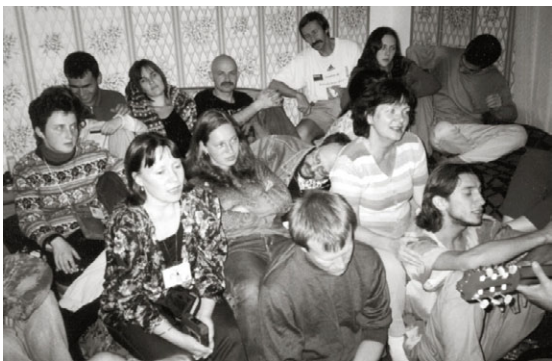
... kaj nokte