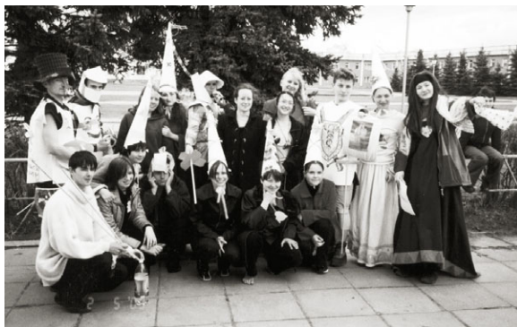
post kelkaj minutoj komenciĝos la kavalira turniro