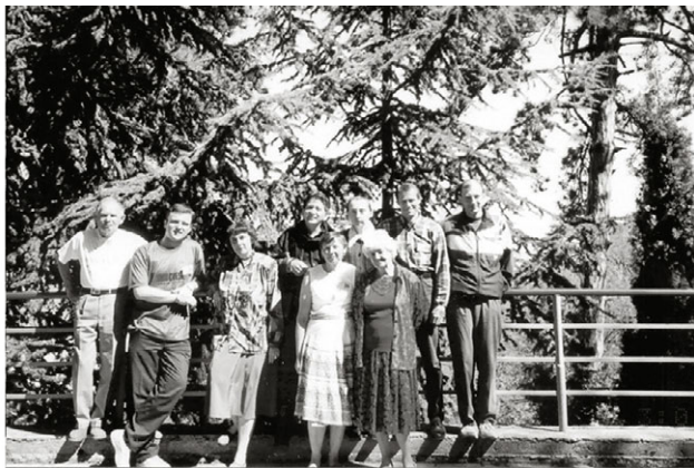
grupo de sukcesintaj dum la C-ekzameno sub himalajaj cedroj