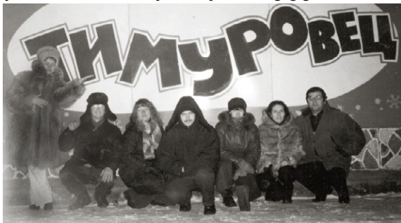
siberiaj frostoj tute ne mankis dum EoLA-15

Ĉu ne ŝajnas al vi, miaj karaj geamikoj, ke ni paŝ-post-paŝo perdas nian kulturon, kaj pri tio kulpas sole ni mem? Kie