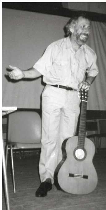
... niaj ŝatataj bardoj

Venis somero – la sezono, kiam okazas multaj E-aranĝoj. En Rusio inter ili elstaras OkSEJT kaj RET. OkSEJT, kiu okazos jam la 43-an fojon (rekordo por amasaj rusiaj E-aranĝoj), ekde 2002 estas ĉefe instrua tendaro