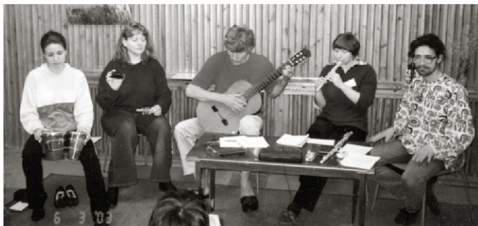
“Atentema VU”, 2003

S. Gitarojn, flutojn, bongojn, diversajn perkutajn ilojn, sonoriletojn, varganojn (kamuzojn), kanteman tason kaj sonorilon, voĉojn, kaj, en stato de pleja tranca inspiro, mi gitarludis per arĉo.