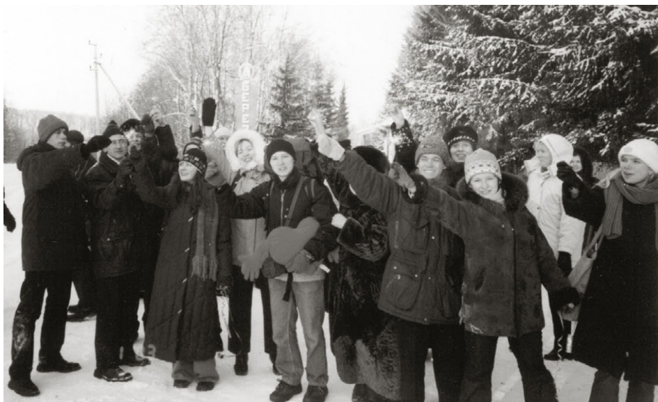
per bengalaj fajroj la partoprenantoj salutas la novan jaron