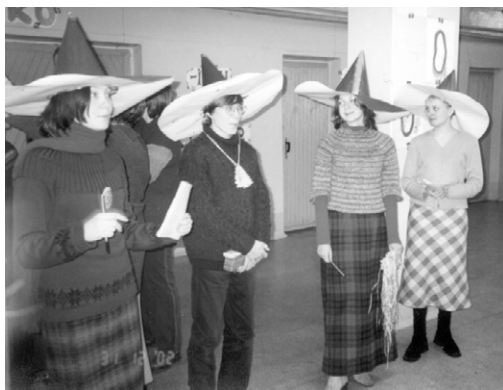
dekanoj de la magiaj fakultatoj

Ĝis magiaj 24:00, kiuj kapablas transformi 2 al 3 kaj ĉevalon al ŝafo, restis amaso da tempo, sed ĝi kuris, rajdis kaj intertempe jete flugis – ĉiuj dezirantoj kaj ne tre estis volonte akceptitaj al la lernejo, renomita kaj dividita je 4 fakultatoj – penskapbla kaj aldone tremkapabla ĉapelo prenis al si dividan taskon. Sur parolanta muro aperis tagordo de magiaj lecionoj – homoj disiris laŭ la aŭditorioj... Poste, kurserĉante la literojn de propra devizo, ili porlonge forgesis pri la malvarmo; sed fakte la plej malfaciala tasko estis diveni tiujn devizojn, ĝuste kunmetinte la akiritajn literojn.