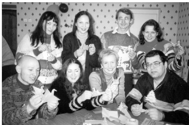
magia kurso pri paperfaldado

“Estu ĉi-jare bone al vi... nu kaj al mi kune kun vi”. Gratulojn okaze de la nova jaro!