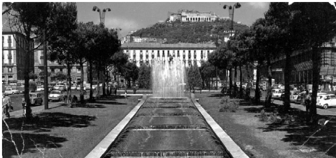
Napoli: Piazza Municipio – Municipa Placo

Subite miaj ĝojaj rememoroj sombrigis. Ĉu se Napoli same malbele ŝanĝiĝis, kiel Pavia?!