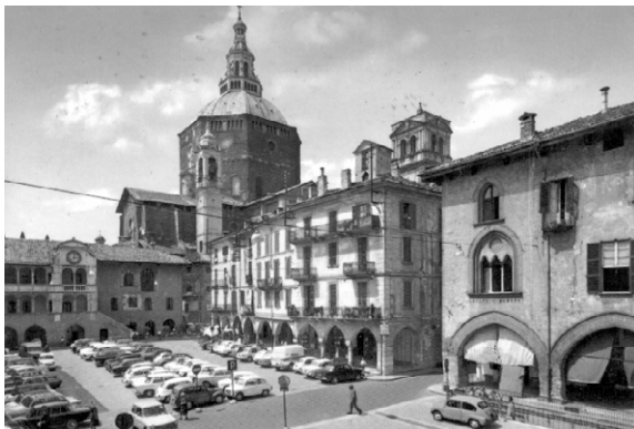
Pavia: Piazza della Vittoria – Placo de la Venko

Ĉu mi estas pli timiga ol iliaj malbelegaj domoj?!