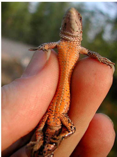
REJMiĝu kaj malkrokodiliĝu!

Aliĝante al REJM promespago vi rajtas partopreni en la reta grupo <nur-rejm>, via nomo (kun eventuala foto) aperas en la membrolisto (interalie, ankaŭ en nia Interret-paĝaro), vi ĝuas la etoson ktp. Tamen promespago NE donas al vi REGo-abonon, rabatojn dum la aranĝoj kaj voĉdonrajton dum la Konferenco. Tio signifas, ke vi restas nominala REJM-ano, sed se vi volas ĝui REJM-avantaĝojn, vi pagu. Ekzemple tuj antaŭ REJM-Konferenco aŭ tuj antaŭ EoLA – kiam estas por vi plej facile.