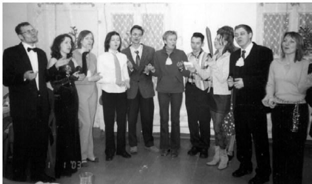
la ĉeboksara koruso

Proksimime post 3 horoj antaŭ du niaj okulparoj aperis la bazejo “Berjozka” kun ĉiuj siaj belaĵoj, vestita per eterna frido pro malbona hejtado. Sola avantaĝo de tiu ĉi frido – veninta antaŭ 2 horoj pli ĝustatempa parto de la organiza teamo signifas “malvarmiĝis”, ĉar tuta ilia antaŭsupozata kolero pri ni jam estis elspeziata por varmiĝo.