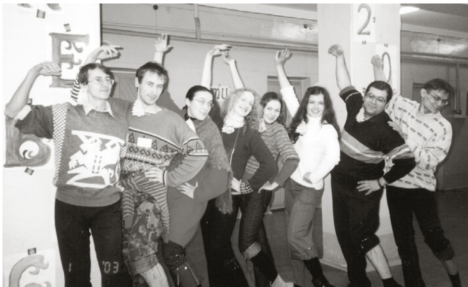
la teamo dum unu el gajaj konkursoj