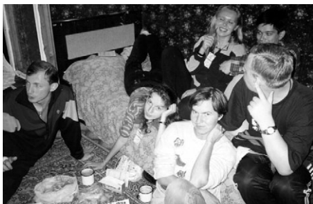
kutima nokta “diboĉo” en ĉambro