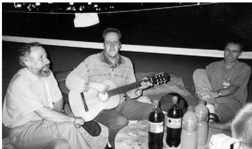
Interkona vespero ĉe la plaĝo