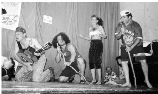
“punk”-grupo sur la scenejo