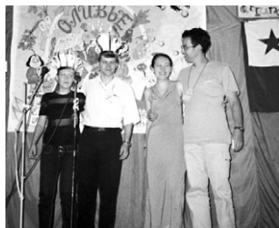
la organizantoj gratulas la geprincojn