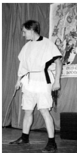
aktoras Saša Blinov