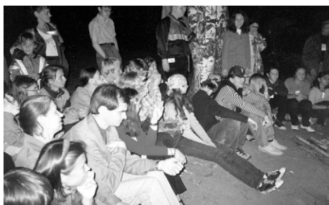
al kio ili rigardas? certe al lignofajro!