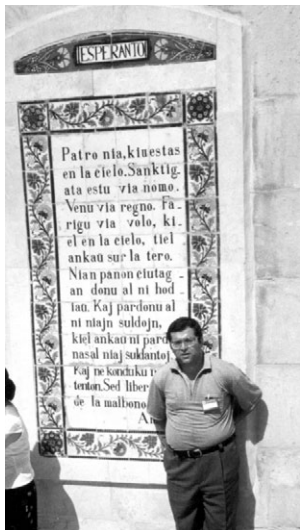
Preĝo en Esperanto en la plej antikva preĝejo de la mondo