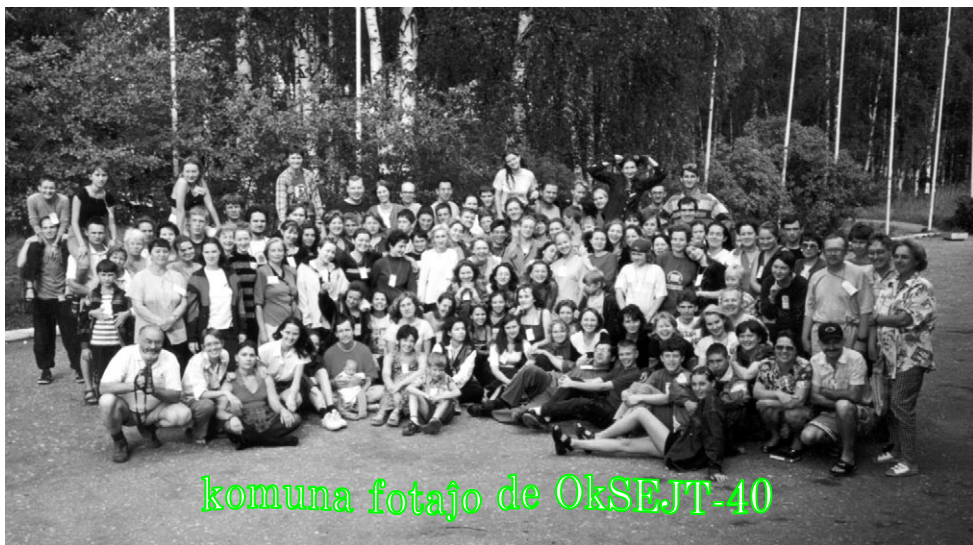
komuna fotajo de OkSEJT-40