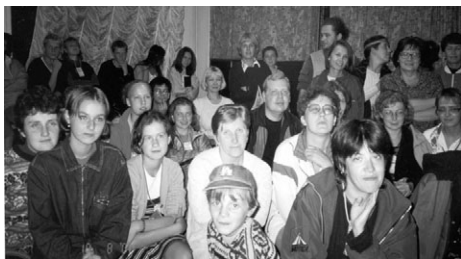
spektantoj en nokta kinohalo