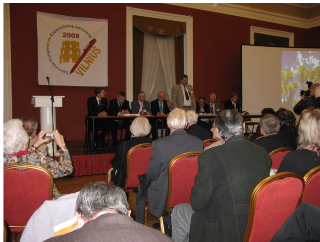
la Solena Malfermo

Danke al la subteno de litoviaj aŭtoritatoj la kongreskunsidoj pasis en la malnova urbodomo de Vilno kaj en la parlamentejo de Litovio; la loĝado, manĝado kaj ekskurso estis senpagaj por la kongresanoj. La prezidanto de la parlamento, Česlovas Juršėnas, bonvenigis la kongresanojn en la parlamento, kaj vespere