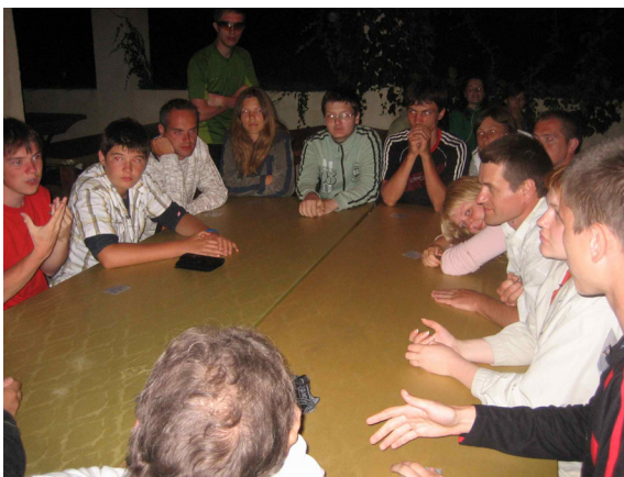
junularo ĉiunokte ludis “Homlupojn”, fojfoje eĉ en E-o