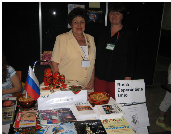
tablo de REU dum la Movada Foiro