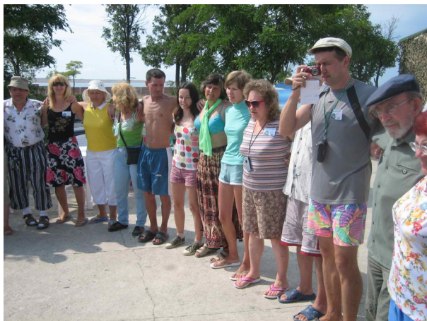
tradicia Amika Rondo

Esperanto dupersonan scenigon de la “Longa lango”, modernigitan de mi. Krome ni proponis al dezirantoj provi sin kiel aktorojn – partopreni dutagajn provludojn de alia fama Ĉeĥov-rakonto “Ĉevala familinomo”. Tuj aperis dezirantoj, plej multe el Jelec, kaj la 6-an de julio la prezento okazis. La vesperon finis mi per originala ĝenro “Anekdotoj pri mi – forgesema”.