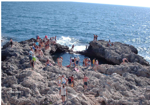
naĝado ĉe Atleŝ