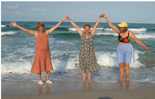
Ni ĝojas! Ni kunas!