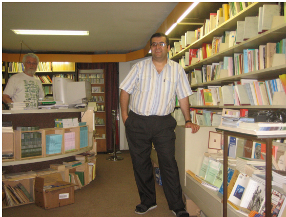
en la Libroservo de UEA