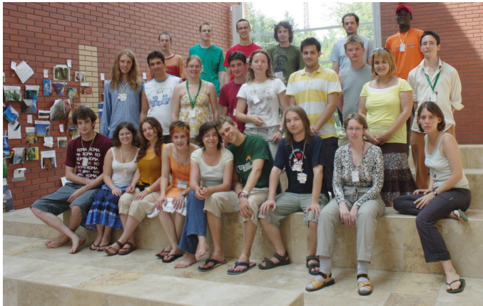
la komitato de TEJO