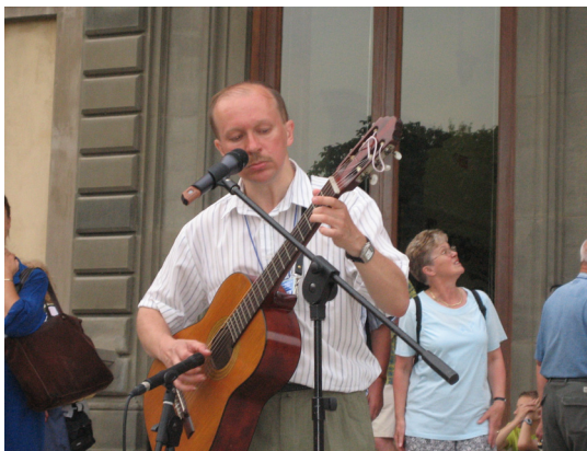
kantado dum UK en Florenco