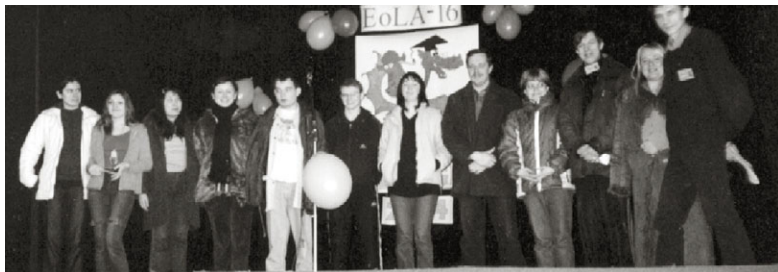
la organizantoj sur la scenejo