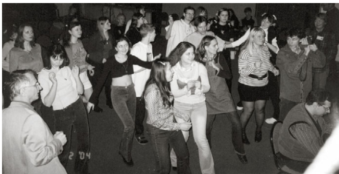
nur kadavroj kapablus resti senmovaj dum koncerto de JoMo

Ankoraŭ ne estas decidite pri la loko(j) de REK kaj EoLA en 2005. Mi opinias, ke ni devas plu klopodi okazigi ilin sinsekve kaj samloke. Unue tio donas eblon al dezirantoj partopreni du gravajn aranĝojn per unufoja vojaĝo,