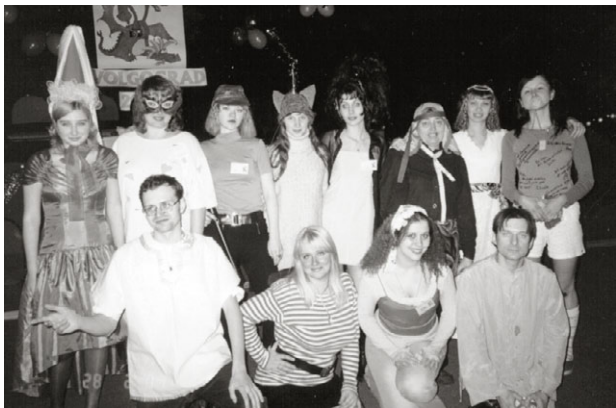
partoprenantoj de la konkurso pri kostumoj