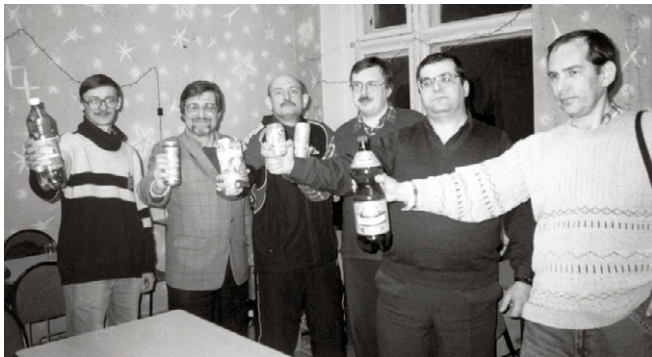
nova Estraro de REU tostar

11. Rekomendi al la Estraro forpreni al REU la posedrajton por la ret-paĝaro de REU.