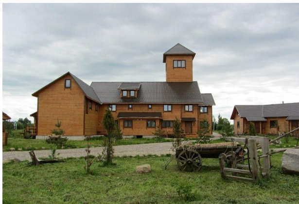
Strangula korto – la loko de RET-2017

РОССИЙСКИЙ СОЮЗ ЭСПЕРАНТИСТОВ Брошюра участника Российских Дней Эсперанто, посвящённых 140-летию со дня рождения Ивана Ширяева Ярославская обл., г. Пошехонье, 02-09.08.2017